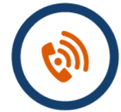
easybell Office Komplett