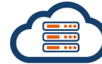
easybell Cloud Telefonanlage